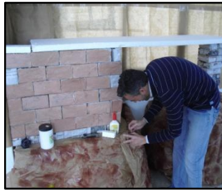
Torre de la Malmuerta