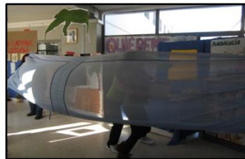
Caimán de la Fuensanta