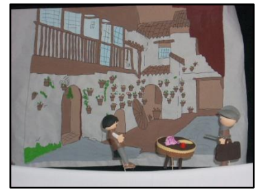
Posada del Potro