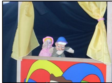
Casa de Orive