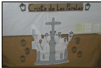
Cristo de los Faroles