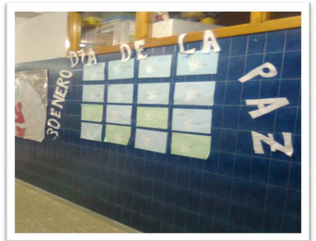
MURAL CON MAESTRAS 4 AÑOS