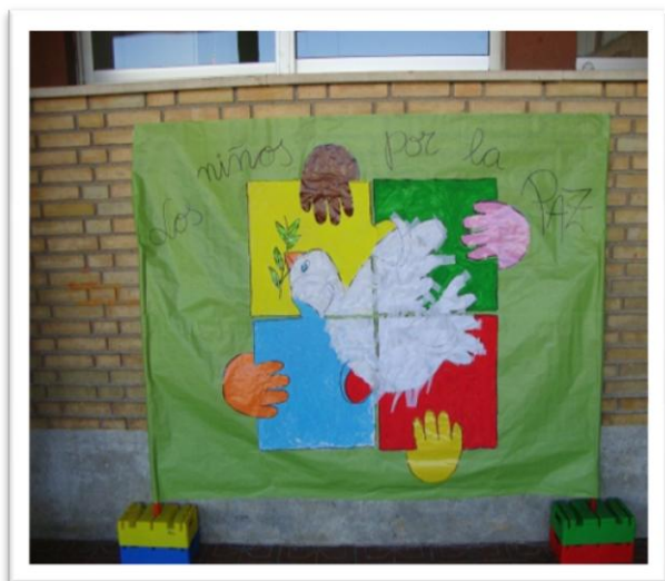
MURAL CON MAESTRAS 5 AÑOS

Aquí os mostramos algunas de las fotos de las diversas experiencias vividas: