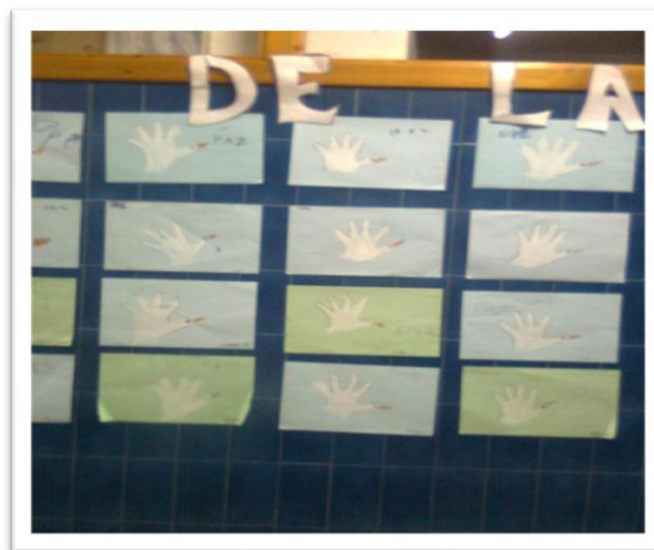
DIBUJOS DE SÍMBOLOS DE PAZ