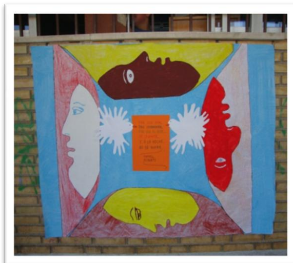
MURAL CON MAESTRAS 3 AÑOS