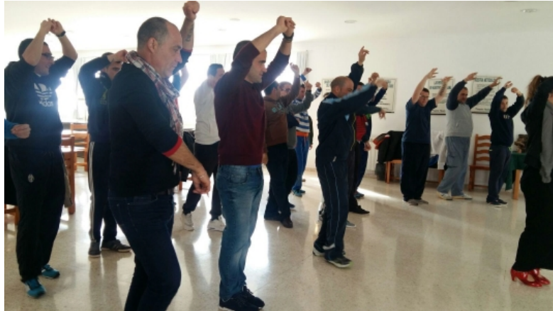
Figura 3. Taller de baile flamenco en Proyecto Hombre

importancia de la asistencia a la escuela en asentamientos de rumanos o de concienciación sobre la gravedad del bullying entre escolares de Educación Secundaria. También hubo que hacer en este período más materiales, ajustes de horarios y un nuevo reparto de tareas.