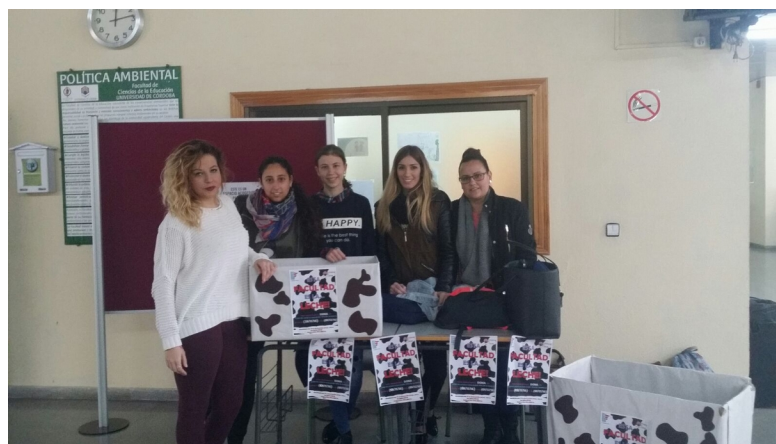
Figura 4. Recogida de alimentos en la Facultad de Ciencias de la Educación