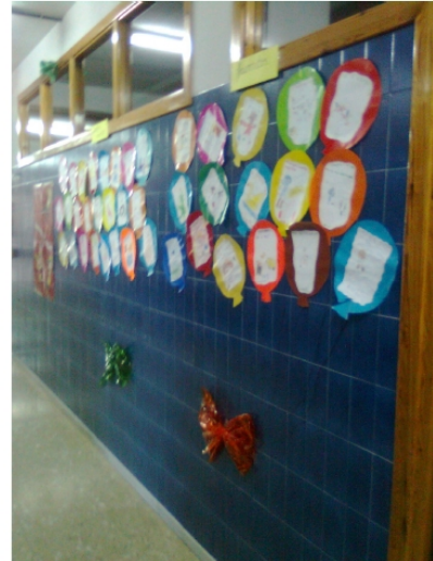
Alumnado de 4 años de Educación Infantil