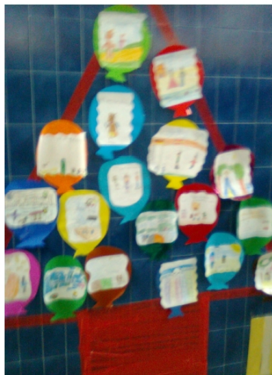
Alumnado de 5 años de Educación Infantil