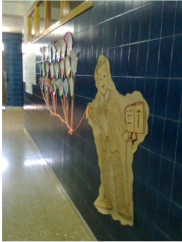
Alumnado de 3 años de Educación Infantil