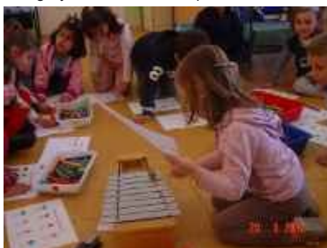
Juego y actividades de aplicación