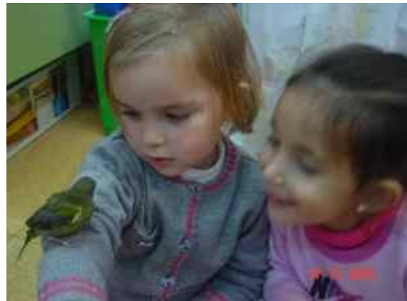
Observamos un gorrión