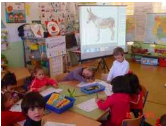
Buscamos en Internet