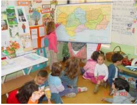
Provincias de Andalucía