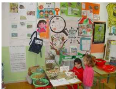
Rincón del Proyecto Los gorriones