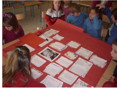
Biografía y obra de Alberti