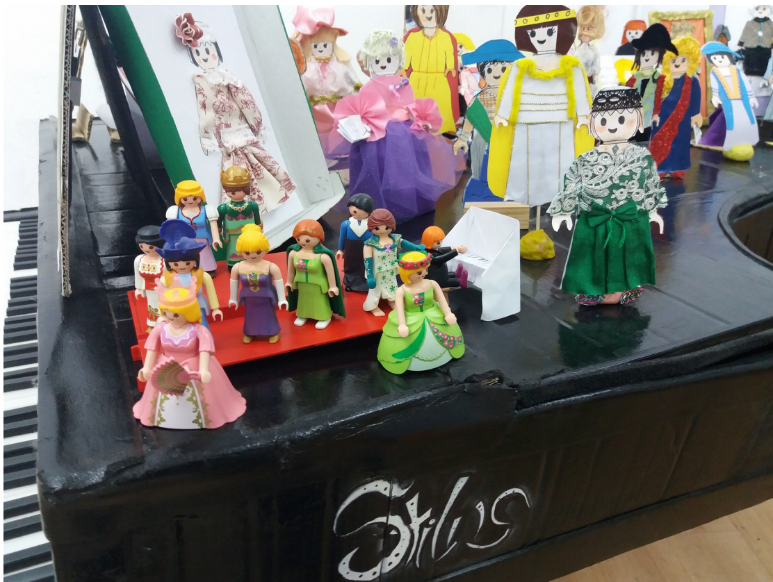
Foto 1: Rincón de la música en la exposición del CEIP Antonio Machado