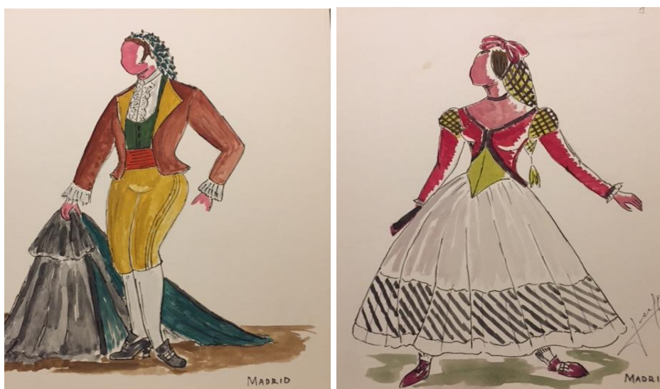
Foto 4.- Dibujo realizado por Juanjo Linares. Pareja de bolero/Madrid. Año 1999

Esta noticia fue una realidad pues con el interés que presentaba la colección sentimos de obligada acción establecer algunas gestiones para que las autoridades educativas, a nivel de la Junta de Andalucía, valorasen lo que podría ser una potencial adquisición vinculada al CPD “Luis del Río”, y por ende a la ciudad de Córdoba.