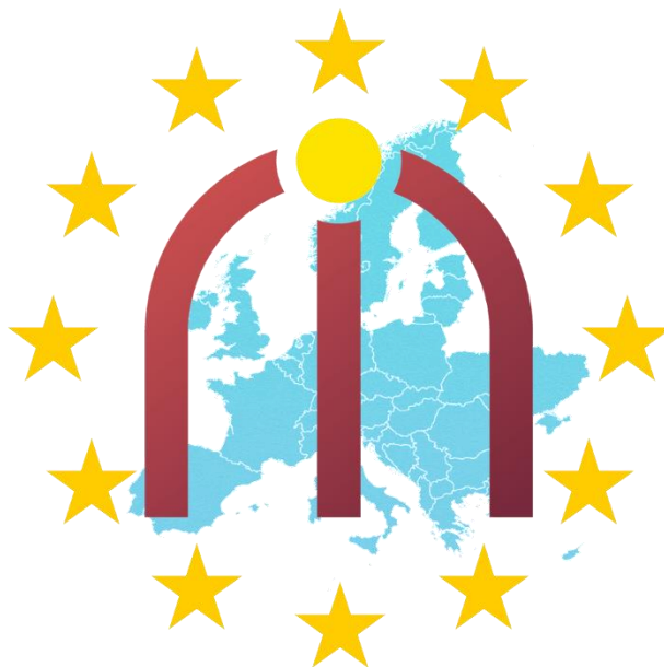
Logo de internacionalización del IES Trassierra

6. La difusión es un aspecto fundamental en los proyectos Erasmus+. Pues bien, más allá de aparecer en prensa, publicar en webs y redes sociales, etc., pocas actividades de difusión tienen más impacto que invitar a profesorado y alumnado de otros centros a participar en alguna actividad del proyecto. Pongo un ejemplo: alumnos/as de institutos de toda la provincia (Trassierra, Ángel de Saavedra, Luis de Góngora, Ipagro, Santos Isasa, Itálica (Santiponce, Sevilla), Jerez y Caballero, Puente de Alcolea, Clara Campoamor, Fernando Solís y Profesor Andrés Bojollo) completaron el aforo del Teatro Góngora el día de la representación de la obra The Right Decision , una de las principales actividades del proyecto KA219 “European Active Citizenship (EAC)”.