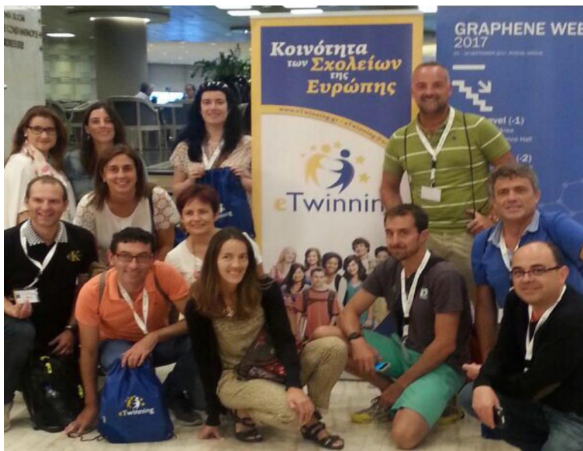
Evento presencial eTwinning en Grecia

Siguiendo la cronología, en 2017, asistí a un evento presencial eTwinning a Grecia: “Learning to think in a digital society”. Los eventos presenciales eTwinning se convocan una vez al año y se solicitan a través de la sede electrónica. Hay un baremo y en función de la puntuación obtenida y de las plazas que haya, se puede optar a ellos. Suelen ser de 3 o 4 días, pero muy intensos, bien aprovechados y de los que puedes obtener ideas para nuevos proyectos o nuevos socios.