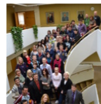
Let's play economy 05.04.2010

The analysis of historical and scientific data will enhance the application of Mathematics in other disciplines and give evidence to Mathematics importance in the everyday life. Mathematics is a common language used by other sciences to create models and to share knowledge. We will use this to share knowledge among European...