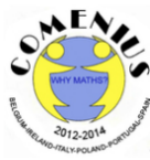
Why Maths? - 2012-2014 11.09.2012

( https://ec.europa.eu/programmes/erasmus-plus/projects/eplus-project-details/#project/EST-2012-1-ES1-COM06-52752 ).