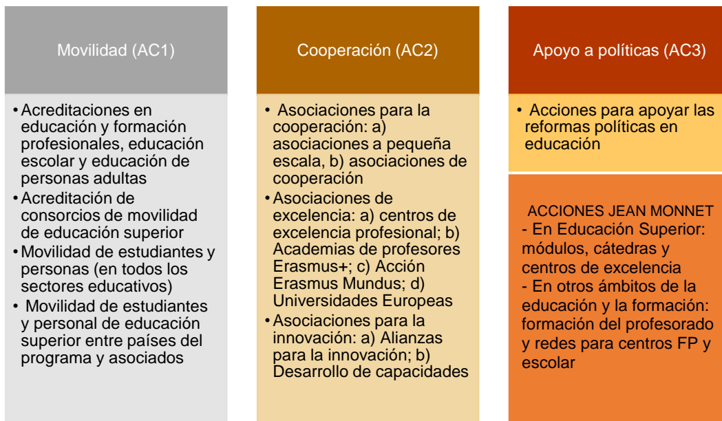
Figura 3. Arquitectura de Erasmus+ (2021-2027).

Fuente: elaboración propia a partir de convocatoria Erasmus+ 2021.