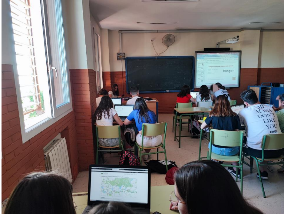
Ilustración 3. : Visión general de una de las aulas con las distintas parejas o tríos trabajando su lugar de memoria. En la pizarra digital podemos observar una diapositiva tal y como el alumnado se la encontraba para empezar a trabajar.

No podemos olvidar que cada lugar de memoria tiene tres diapositivas, una por cada grupo-aula. A continuación, vamos a ver algunos ejemplos de diapositivas ya terminadas por el alumnado, mostramos ejemplos de distinta calidad académica en cuanto al resultado.