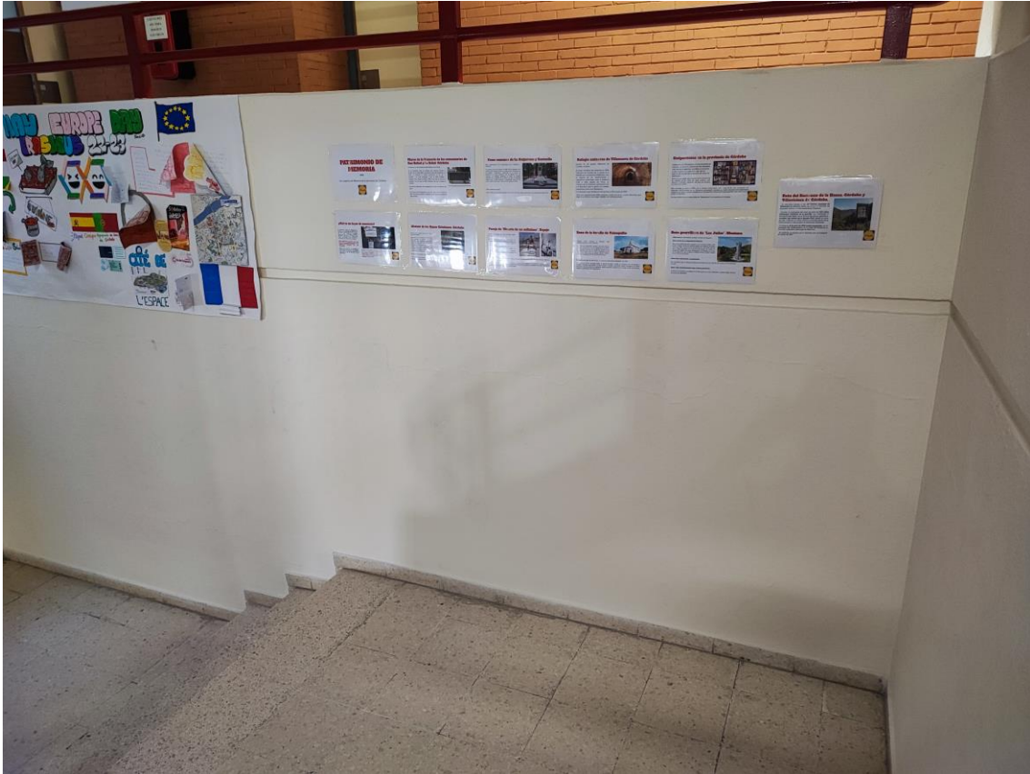
Ilustración 9. Diapositivas-paneles expuestos en la escalera del centro en la semana del Día escolar de la Memoria Histórica y Democrática.