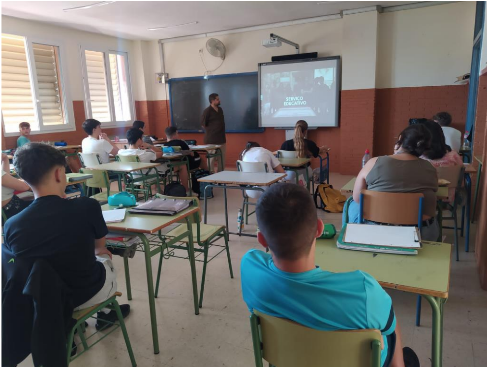
Ilustración 1. Momento de la visualización del Museo Aljube de la Resistencia y la Libertad de Lisboa (Portugal). El fotograma alude a la tarea de servicios educativos que tiene el museo para la conservación de la memoria democrática portuguesa.

La orientación que se le daba al alumnado es que tomaran apuntes para que toda la explicación de este primer día, además de marco general de cara a trabajar los lugares de memoria, sino como elementos que luego debían estar presentes en el informe individual.