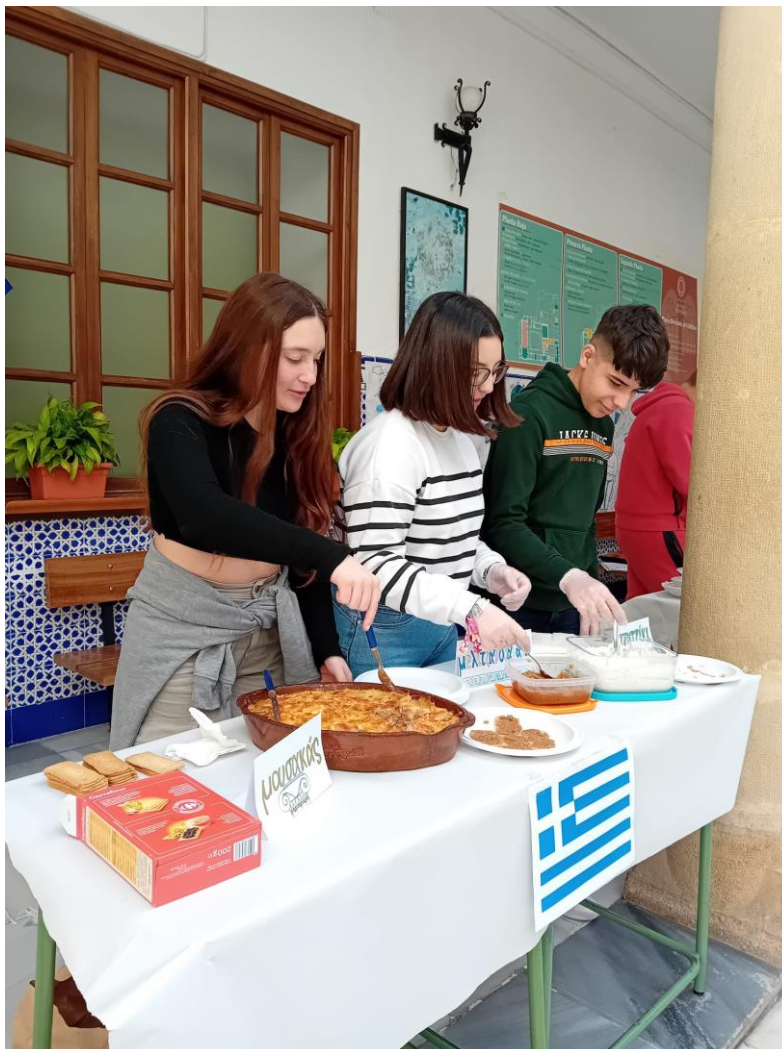
Fig. 3: Dando a degustar platos típicos griegos en un stand del Desayuno Internacional.

programación de nuestro Abril Cultural, el alumnado de Bachillerato que cursa Griego 1 aprende a elaborar recetas griegas que se dan a degustar en la Sala del Profesorado o en alguno de los patios del Instituto en la media hora dedicada al recreo. Este curso 2023-2024, por ejemplo, colaborando con el Plan de Plurilingüismo, se decidió organizar un Desayuno Internacional en el que participó toda la comunidad educativa y en la que estuvieron presentes países como España, Grecia, Italia, Reino Unido, Francia, China, Irlanda y Rumanía.