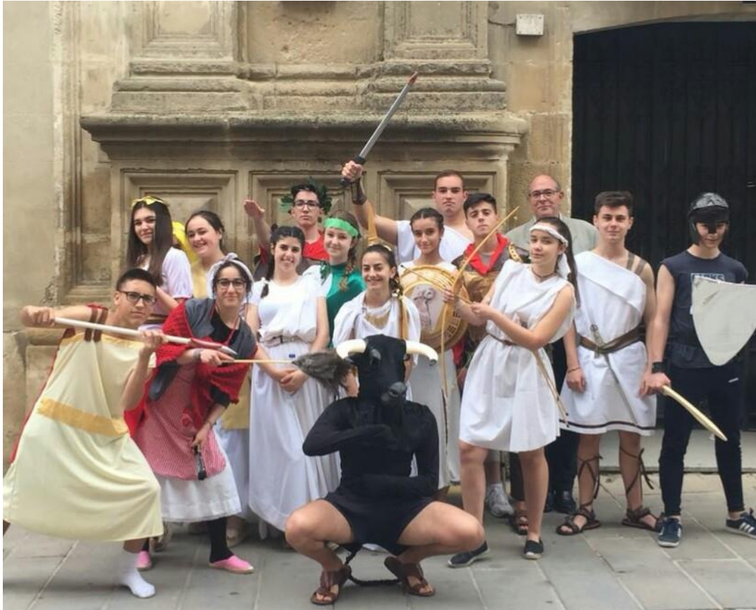
Fig. 7: Alumnado de 4º de ESO pasea la Mitología por las calles de la ciudad.