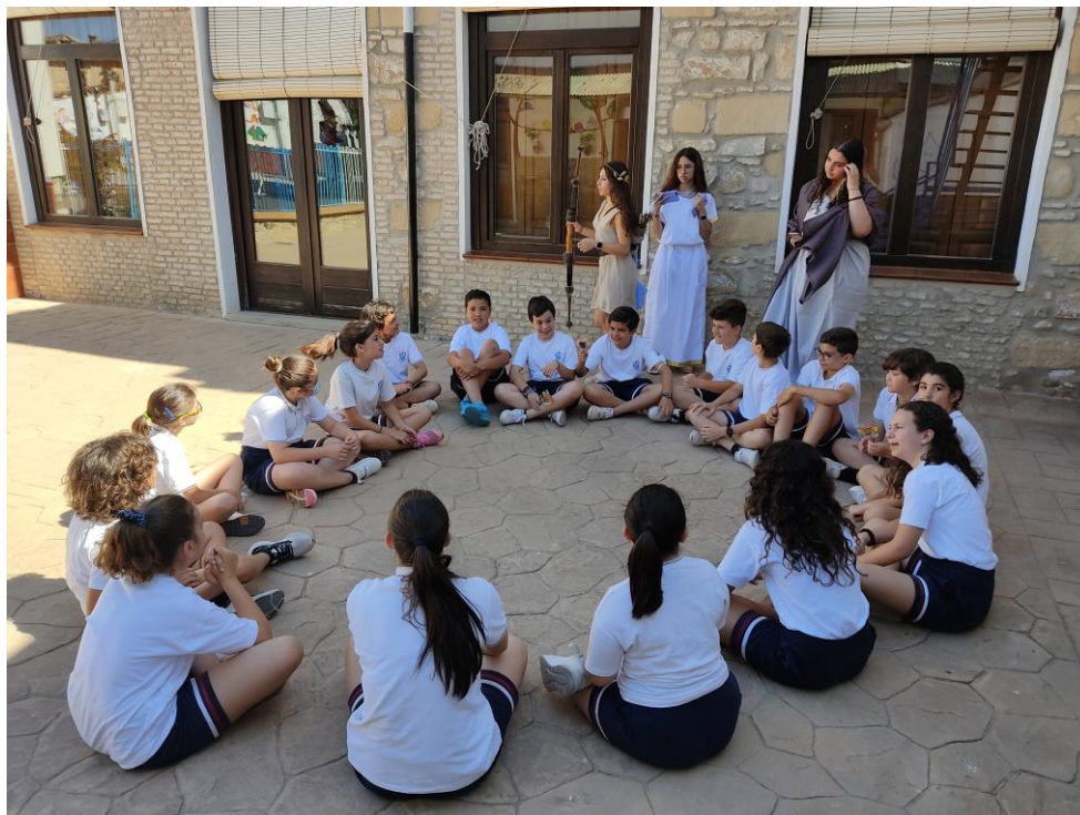
Fig. 5 y 6: Juegos ofrecidos para alumnado de 1º de Bachillerato y 5º de Primaria

En otra línea, también se ha ofrecido al alumnado de 4º de ESO que cursa la asignatura de Latín la posibilidad de organizar una actividad mitológica en el tercer trimestre con la novedad de que ésta se realiza fuera del Instituto,