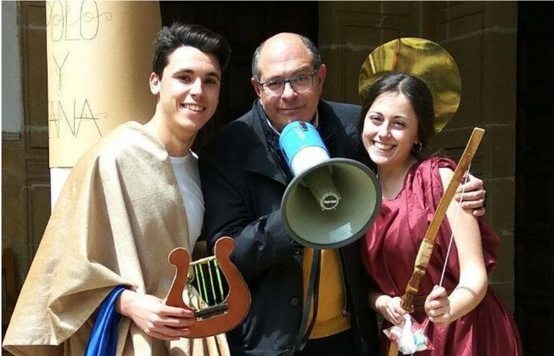
Figura 1 El profesor y dos de sus alumnos preparándose para los juegos mitológicos de 1º de ESO

Citar artículo: VALVERDE GARCÍA, A, (2024): Encyclopaideia: Gamificación y experiencias interdisciplinares a partir de la asignatura de Griego antiguo . eCO. Revista Digital de Educación y Formación del profesorado . nº 21, CEP de Córdoba.