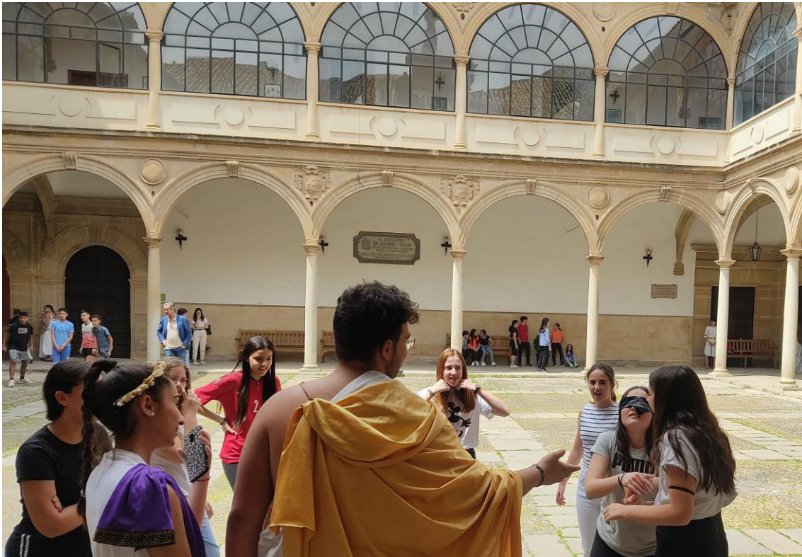
Fig. 4: Juegos relacionados con la Mitología preparados para el alumnado de 1º de ESO.

Un día del mes de abril del año 2010 se nos ocurrió que el alumnado de Humanidades podía preparar, a última hora de la jornada, una actividad lúdica tomando como guía un librito del profesor Fernando Lillo Redonet titulado Ludus. ¿Cómo jugar como los antiguos romanos? Para una perfecta organización se eligió a un alumno que haría las funciones de coordinador, y, entre todos, se fueron seleccionando aquellos juegos que nos parecían los más idóneos. La idea fundamental era que sus compañeros más pequeños de 1º de ESO pudieran aprender cuestiones relacionadas con la vida cotidiana en la antigua Roma de una forma más atractiva. Por eso los que harían de monitores, además de vestirse de forma adecuada con peplos y sandalias, en