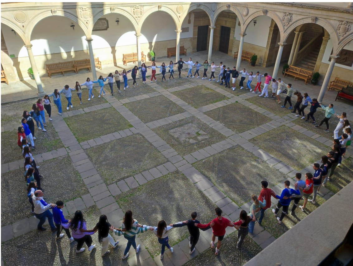
Fig. 2: Taller de danzas griegas en el patio de la Antigua Universidad de Baeza

Si hay algo que realmente enfurece al alumnado del Bachillerato de Humanidades de nuestro Instituto es que algunos de sus compañeros les echen en cara que se pasan todo el día de fiesta, disfrazándose y jugando, mientras que ellos tienen que realizar arduas tareas científicas y matemáticas.