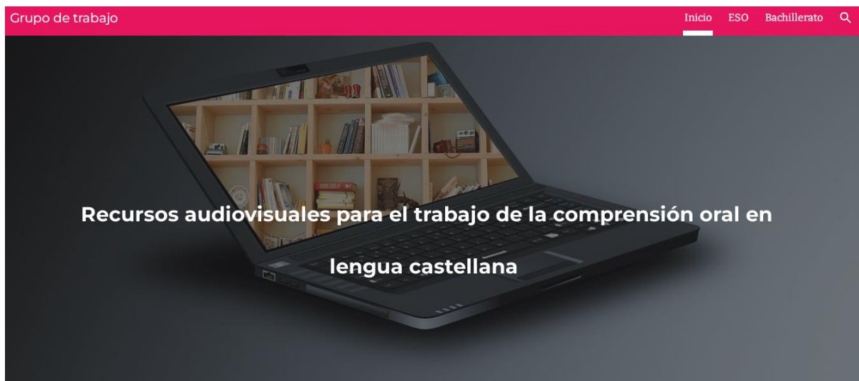
Fig. 1. Pantalla de inicio de la página web

A modo de ejemplo, mostramos a continuación un recurso disponible. Al entrar en el enlace de la página web, aparece la siguiente pantalla de inicio: